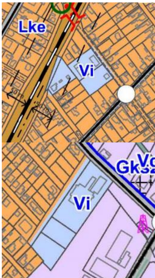
Hatályos Szerkezeti terv kivonata