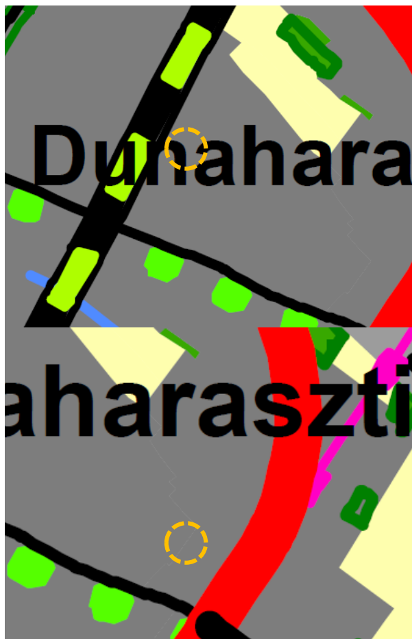
BATrT Szerkezeti terv kivonata