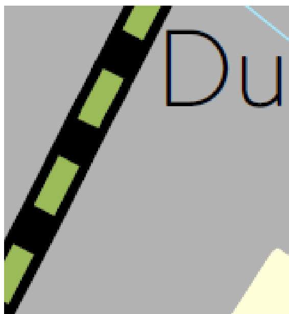
BATrT Szerkezeti terv kivonata

A rendezéssel érintett terület települési térséget érint.