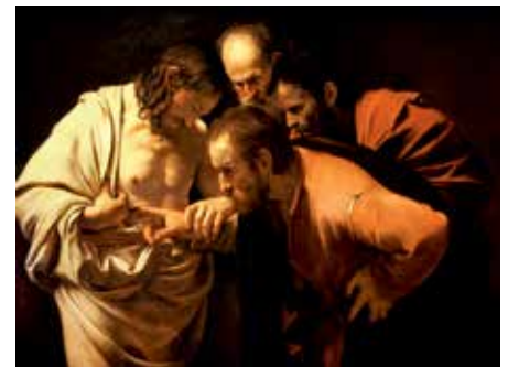
Caravaggio: Hitetlen Tamás

is. Persze sose volt egyszerű megélni a hitet. Jó és rossz időkben is figyelni a Teremtő, Megváltó szavára, ez kihívást jelent. Fontos az apostol figyelmeztetése: mindent vizsgáljatok meg. Mit jelentsen ez a felhívás a 21. század embere számára? A keresztény hit nem a hiszékenység hite. Áldott emlékü professzorom mondta: minden hit annyit ér, amennyi kételkedés van mögötte. Kérdéseim vannak saját magam felől? Ki vagyok én, miért vagyok itt, ebben a helyzetben? Senki nem kérte a maga életét, azt kaptuk. Józan belátás lehet, hogy felismerem teremtményi voltom. A másik emberben is megláthatom a teremtettségét. A hitben felismerem, hogy a bűntől, haláltól megváltott vagyok, minden embertársammal együtt. A teremtett világ is tanúskodik az Alkotójáról. A testi-lelki törvények csodálattal tölthetnek el. Minden természettudomány megpróbál titkokat fejteni, hogy egyre élhetőbb legyen a világ. A tudásunknak köszönhetően egy csomó betegséget tudunk gyógyítani. Meny-