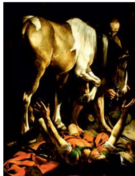
Caravaggio-Damaszkuszi út - a kép illusztráció

Itt érkezi el a néhány napja következő választásokig. Régóta nem volt ilyen zajos a magyar közélet. A demokráciában – vélelmezem – minden olyan párt megérdemli a politikai versengést, amelyik megszerezte a húszeszes benevezési limitet. Ez nagyon jól van így. Mondom ezt úgy, hogy hatvanhetedik évemben még soha nem éreztem úgy, hogy az éppen megválasztott, uralkodó párt lett volna az álmaim álma. Amikor választunk nem a politikai pártot, hanem véleményem szerint, saját magunkat is minősítjük. Hova adom a bizalmamat. Kiben, miben bízom? Kire, mire bízom a jövőmet, a gyerekeim, unokáim jövőjét? A távolmaradás nyilván nem lehet opció. A politikába