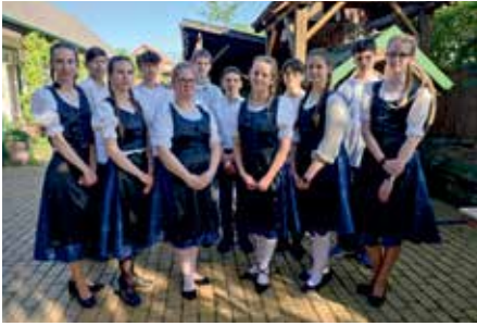
8.d osztály fellépő tanulói

A Dunaharaszti Nemzetiségi Német Önkormányzat minden évben állít májusfát a Tájház udvarán. Idén a nyolcadik évfolyamosaink vállaltak szerepet az fa felállításában, valamint az azt követő ünnepi programokban. A hetedik és a nyolcadik évfolyamos fiúk karöltve vitték a fát a Kegyeleti Parkból a Tájházig, ahol az ünnepség az énekarunkkal kezdődött. A diákok elénekelték a magyarországi németek himnuszát. Majd a 8.d osztály lépett fel egy tánccal a városunkban működő táncsoportok mellett. Köszönjük szépen a DNNÖ meghívását az ünnepségre.