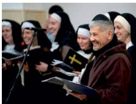
...a vidám kórus

A Dunaharaszti Német Nemzetiségi Önkormányzat szervezésében vasárnap (február 11-én) temették el a farsangot. Az esemény a Mese Óvoda gyermektáncosai és a HFSE Kleine Rosinen gyermekcsoport műsorával kezdődött. Ezután kísérték mély részvétellel a Farsang Seppi-t utolsó útjára hagyományos keretekben, de egy kicsit a napi