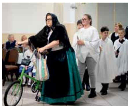
...ez nem akármilyen gyászmenet