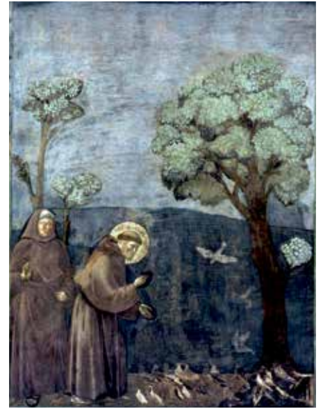
Giotto di Bondone festménye (a kép illusztráció)

A Biblia nem így gondolja. Az Istent vesztett embernek lehet más útja is. De ne felejtjük, csak a mesebeli Münchhausen báró tudta magát kiemelni. Amikor Pál apostol ráébred, saját tapasztalat okán is, hogy Isten jelen van a világban, sőt működik is, tesz egy érdekes megállapítást a második korinthusi levélben. Megélt hit-tapasztalat alapján írja: „Ezért ha valaki Krisztusban van, új teremtetés az: a régi elmúlt, és íme új jött létre. Mindez pedig Istentől van...” (2Kor 5,17-18) Adyval mondom, „ha valaki megtelik Isten szerelemmel”, mintha kicserélték volna. Ez nem egyszerűen pszichológia, több és más. A megélt Isten szeretetben, az ember átéli az újjáteremtés csodáját. Új ember lesz. Nem új szerepet játszik, új szerepet kap. A lelke mélyéről fakad a jó. Új szavakat használ: te – neked – nekünk. Már nem