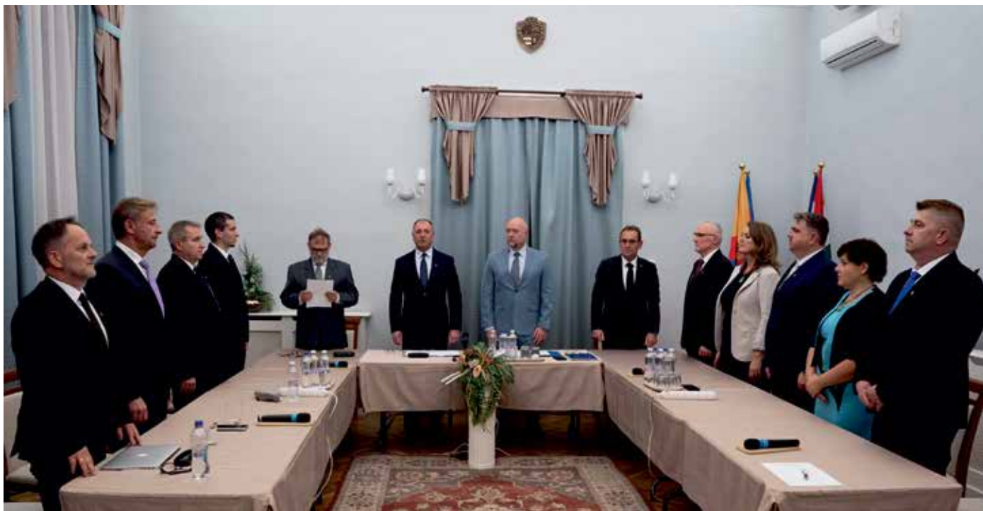
A kép illusztráció az új Képviselő Testület alakuló üléséről

5. Az Önkormányzat november 4-én teszi közzé a honlapján az országos Bursa Hungarica ösztöndíjpályázaton való részvétel feltételrendszerét.