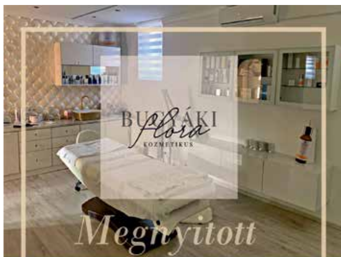
IMAGE SKINCARE KOSZMETIKAI KEZELÉSEK