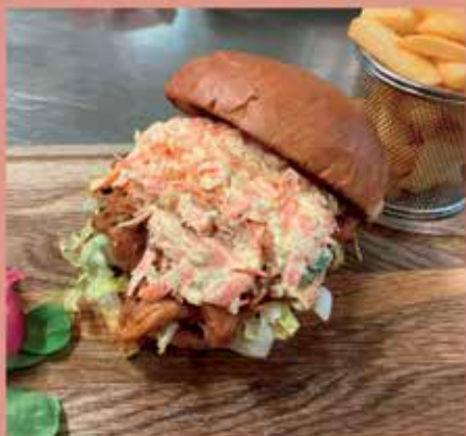
Pulled Pork szendvics coleslaw salátával

Ha egy igazán ízletes, könnyed és gyors étkezésre vágsz, akkor itt a helyed a Kisduna Étteremben, vagy annak mediterrán hangulatú teraszán!