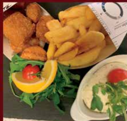
Fish & Chips