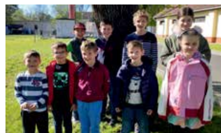
U10-es csapatunk elől és U14-es csapatunk hátul