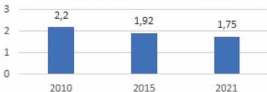
Országos vízfelhasználási arány a Coca-Cola HBC Magyarországnál (felhasznált vízmennyiség/termelt üdítő) [l/l]

A víz erőforrásként való kíméletes és felelősségteljes felhasználására tett erőfeszítéseinkért zalaszentgróti telephelyünk 2014 óta, dunaharaszti telephelyünk pedig 2016 óta rendelkezik az EWS (European Water Stewardship) arany fokozatú tanúsításával. Folyamataink továbbfejlesztésének eredményeképp pedig 2020-ban mindkét telephelyünk megszerezte az AWS International Water Stewardship Standard globális arany tanúsítványát, amely különlegesen értékes szakmai elismerése fenntartható és felelős vízgazdálkodásunknak. Az AWS International Water Stewardship Standard egy olyan globális keretrendszer, ami a jelentős vízfelhasználók számára ad segítséget abban, hogy megértsék és javítsák vízgazdálkodásukat a helyi közösségekkel együttműködve.