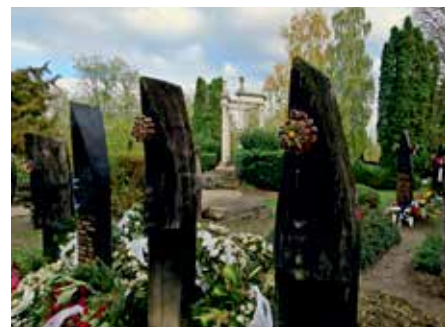
Szatmárcsekei temető, háttérben Kölcsey síremléke

főlrva; de nincs is rá szükség, mert az odalépő vándornak szívdobogása megmondja, ki van ott eltemetve.” Innen mintegy három kilométerre található a túristvándi vízimalom, a Túr egyik ágán (Öreg-Túr). A még működőképes vízimalom, ma, múzeumként funkcionál és egész évben látogatható. Innen pár kilométerre megtekinthetjük a Tiszát „Ott, hol a kis Túr siet beléje, „Mint a gyermek anyja kebelére”. Költői hangulatban haladhatunk tovább észak felé, Csaroda és Tákos irányába. Itt a találjuk a beregi térség két ékszer dobozát, a csarodai és tákosi református templomot. Csarodán egy kis dombocskán áll a terméskő alapozású, téglából épült templom. Hosszúak hajójához a keleti oldalon csatlakozik a négyzetes, saroktámpilléres szentély, amelynek északi oldalán valaha sekrestye állt. A magas, szép arányú templom hangsúlyos része a nyugati homlokzat, amelyen egyetlen kicsiny, félköríves résablak nyílik. Az oromzatot mintegy megkoronázza, az annak folytatásaként égbé törő, tornácos, zsindegyel fedett, karcsú sisakos torony, amelynek falát két szinten ikerablakok törik át. Tákoson van a Felső-Tisza vidékének