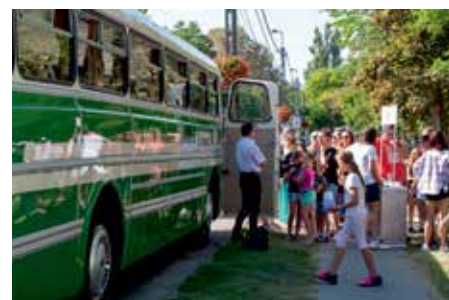
Ismét nagy siker volt a Retróbuszt