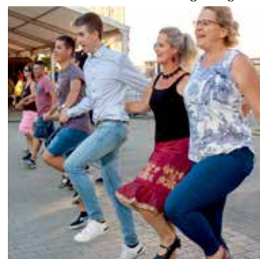
Örömtánc a Táncházban