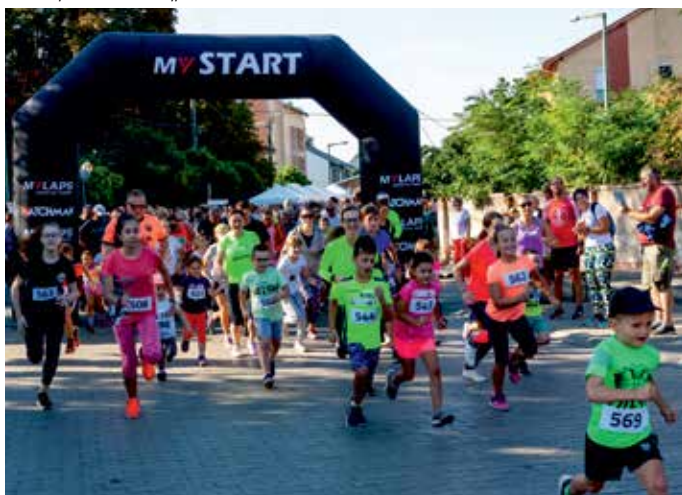
Futóverseny minden mennyiségben