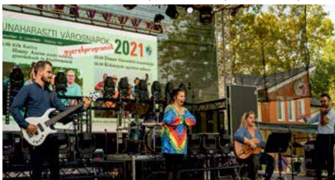
Zenél, mókázik a „KÉK KATICA”