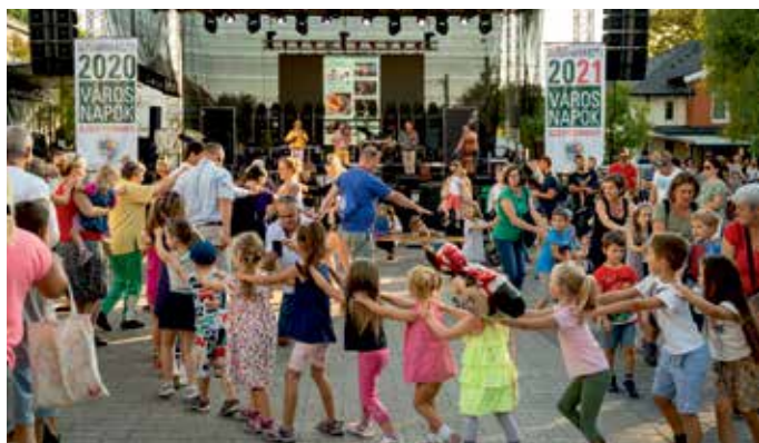
Kolompós show a színpadon és a színpad előtt