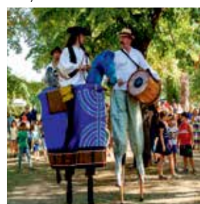
Gólyalábasok és kurtalábúak