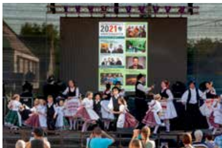
Néptáncosok színes forgataga a színpadon