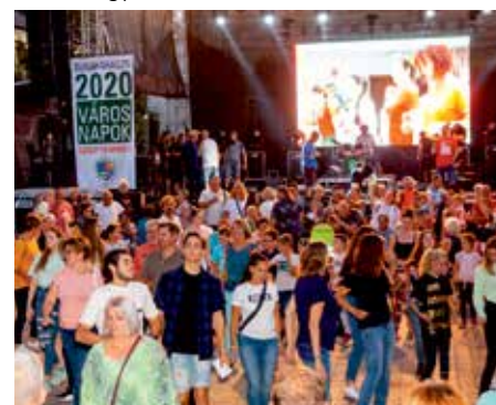
A Jeruzalema a téren lévőket is megmozgatta