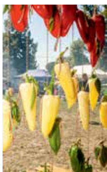
Függöny a lecsófőző versenyen