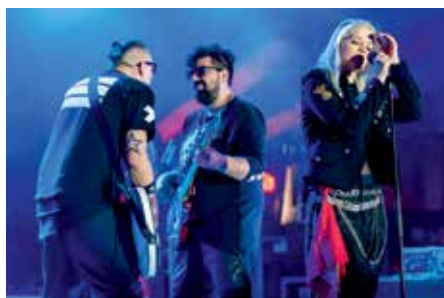
Sugarloaf Muri Enikőve