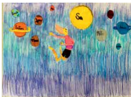
II. korcsoport: 2. helyezett: Bodrogi Boróka, 9 éves