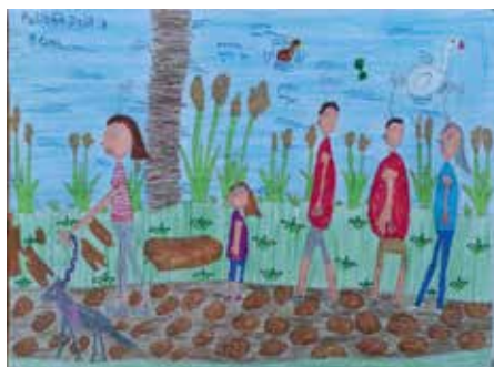
II. korcsoport: 3. helyezett: Polgár Zsófi, 9 éves