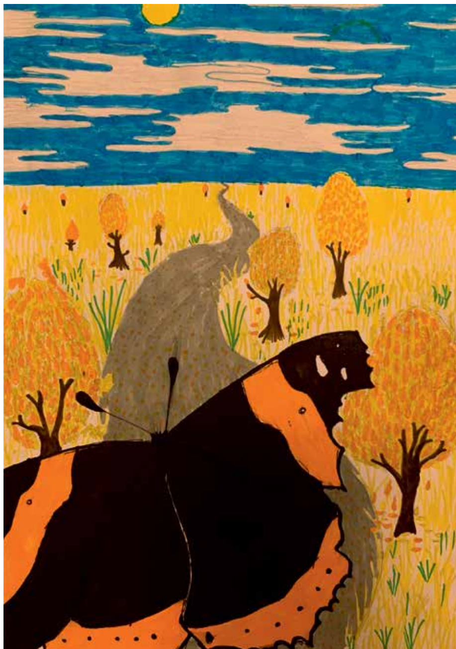
II. korcsoport: 1. helyezett: Erdei Lujza, 9 éves