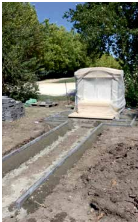
A kút még építés közben

Sokan még emlékezhetnek az ötvenes-hatvanas években is a haraszti „Bolgár kertek” részre, amit úgy emlegettek az emberek, mint manapság pl. a Petőfi ligetet. A „Bolgár kertek” a jelenlegi Piac tér és a Bezer-