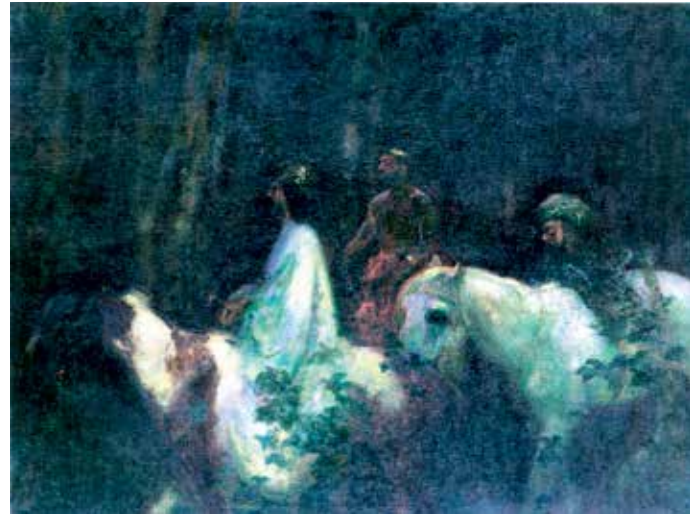
Ferenczy Károly Bölcsek (Királyok) imádása

Mitől olyan népszerű ez az ünnep? Azért, mert profanizálható. Lehet karácsonyfa, csillagszóró, ajándékozás, negédes dalocskák, beigli, hal, töltöttkáposzta, szeretet. Legékeőbb