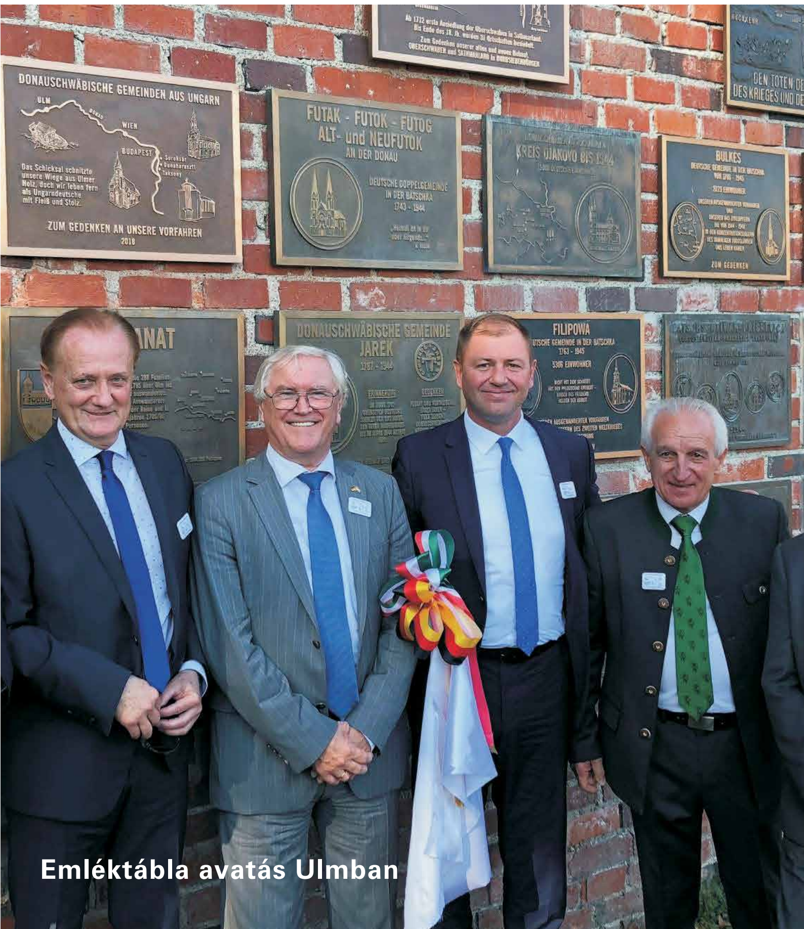
Emléktábla avatás Ulmban

XXVII. évfolyam - 2018 október - Dunaharaszti Város Önkormányzatának Lapja