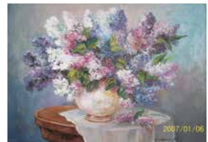
Smidéliusz Anikó alkotása