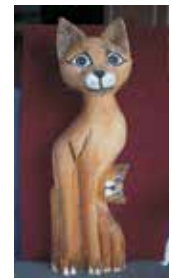
Smidéliusz Jenő alkotása