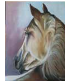
Kisfalvi Judit alkotása