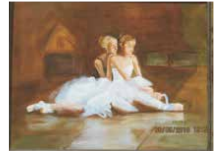
Demjén Gertrúd alkotása