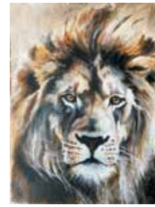
Bojtor Márta alkotása