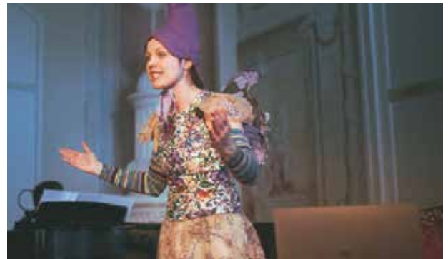
Matiné – Európai mesék