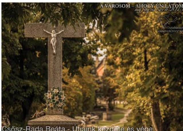
Csőszt-Rada Beáta - Útjaink kezdete és vége