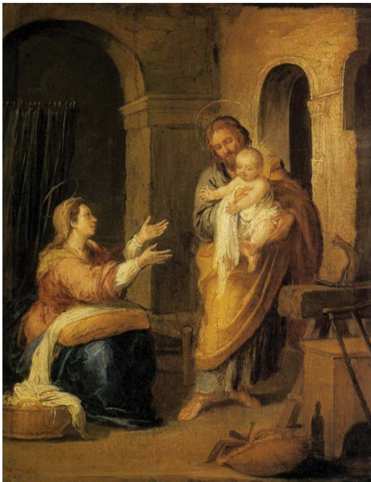
Sagrada Familia I.