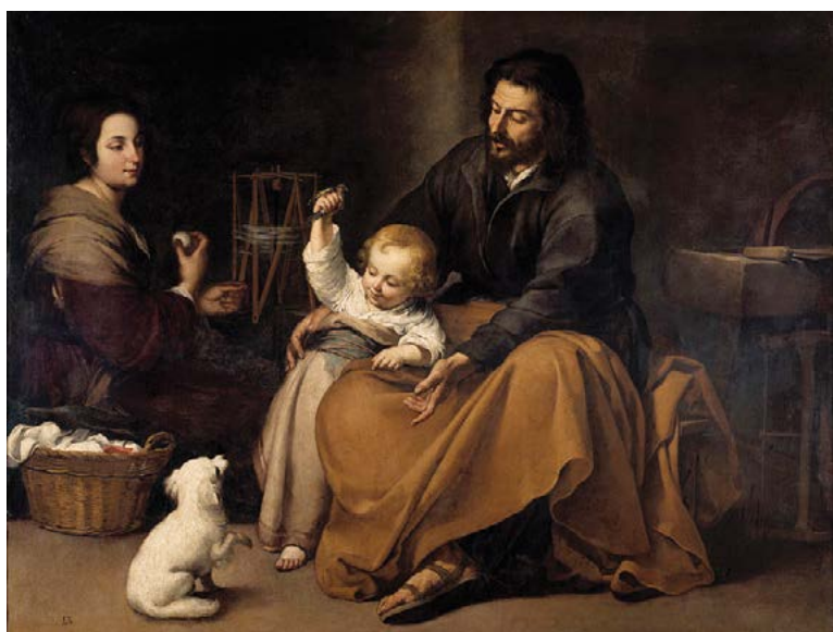
Sagrada Familia II.