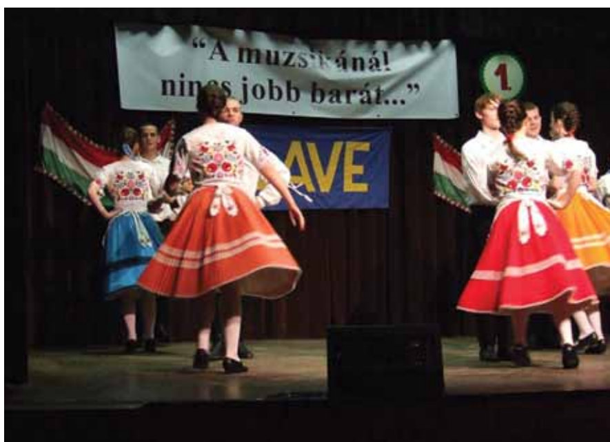
A Rosinen Táncsoport