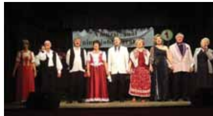
Szeressük egymást gyerekek

port egy olyan fergeteges csárdással vezette fel, hogy csakúgy porzott a színpad. A gyönyörű kalocsai ruhába öltözött táncosok, egyáltalán nem voltak mazsolák. Az igényes közönség percekig tartó vastapssal jutalmazta a tehetséges fiatal táncosok vérpezsdítő produkcióját.