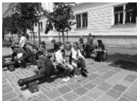
Harangi Fanni 5. a

Azután jött egy másik bácsi egy nagy zacskóval a kezében. A zacskóban sok-sok csúzi, 2 zászló és színes szalagok voltak, meg szivacs-labdák is. Zászlófoglaló, csapatépítő játékot tanított nekünk. Sokat játszottunk, amit nagyon élveztünk. Az osztályból én vállaltam a fotós szerepét. Játék közben vicces képeket csináltam az egész osztályról. Nagyon fáradtan értünk haza, de a beszámolóra azért volt energiánk. Másnap kimerülten, de élményekkel telt mentünk iskolába. Ez egy érdekes, izgalmas és élvezetes osztálykirándulás volt, főleg ezzel a klassz osztállyal.