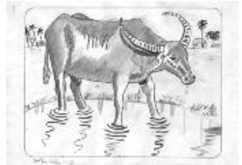
Szalkai Zsófi 10 éves