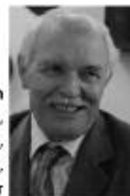
Andrásfalvy Bertalan magyar néprajzkutató, egyetemi tanár, politikus, országgyűlési képviselő, volt művelődési és közoktatási miniszter

Nyitott szívvel és nyitott ajtókkal várunk mindenkit!