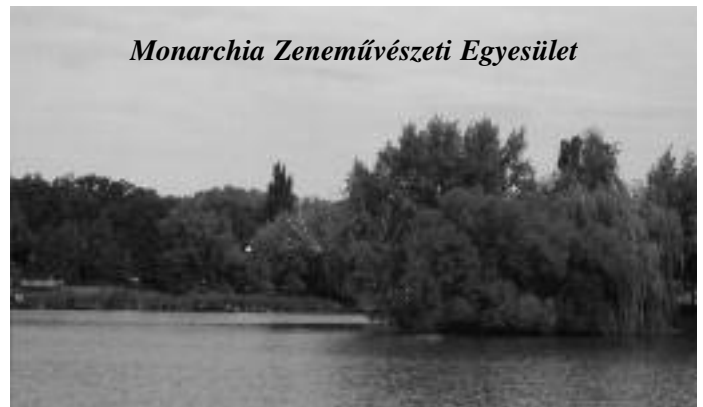
Monarchia Zeneművészeti Egyesület

A résztvevők a szakmai munkán kívül megismerkednek Magyarország fővárosának, Budapestnek, szűkebb hazánknak, a Ráckevei kistérségnek nevezetességeivel, a térségben élő művészekkel. Közösségi programjaink segítik a különböző európai uniós országokból érkező zenészek közötti kapcsolatteremtést, kommunikációt.