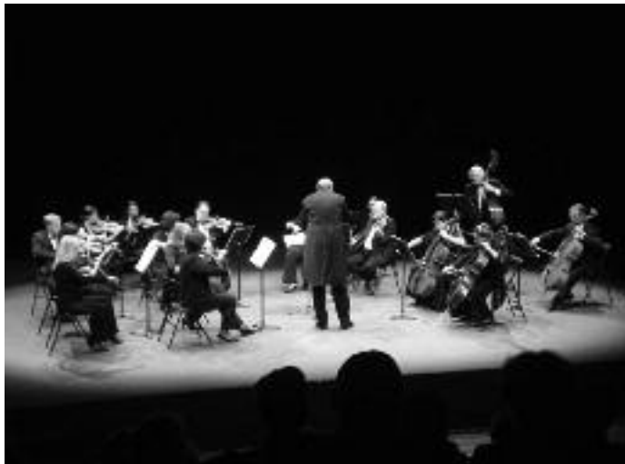
A Muzsikával a civil Európáért projekt programja:

Az Európai Unió 2007–2013 között meghirdette az Európa a polgárokért programot, melynek keretén belül a polgároknak és a civil társadalom szervezeteinek az európai integrációban való közreműködésre ad támogatást. A cél, hogy a civil összefogás segítse a kulturális sokszínűségben Európa nemesebbé fejlődését, az európai tolerancia és kölcsönös megértés erősítését, a kultúrák közötti párbeszédet. Egyesületünk, felismerve ezen elvek jelentőségét, a gyakorlatban is meg kívánja valósítani, hogy az Európai Unió részeként, a zenével meg tudja teremteni a civil társadalmak együttműködését.