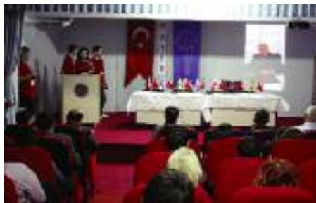
A vízről szóló konferencián, Yalovában