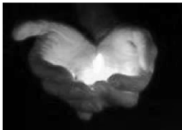
ADVENT 2012 DUNAHARASZTI - TE MIRE VÁRSZ?

Ha részletesebben érdeklik ezek a programok, kérjük, keressen meg minket az egyházközségek honlapján: www.plebi.hu , vagy a gintnero@gmail.com címen!