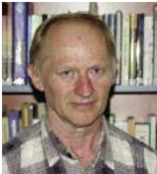
Wágner Máttyás festmények