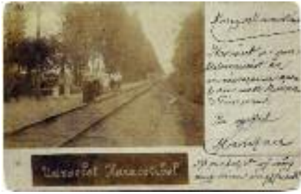
A HÉV-Felső megállója Haraszti Budapest irányába 1899-ben