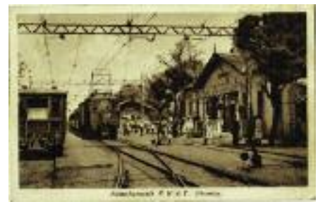
Dunaharaszti HÉV-állomás 1934 körül, villamosított pályával