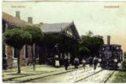
A Dunaharaszti HÉV megállója az 1900-as évek elején gőzmozdonnyal