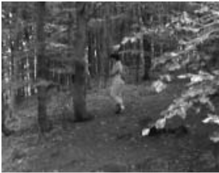
Barangolás az erdőben