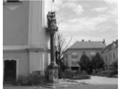
Szent Bertalan nagytemplomból részlet

Sajnos, mindkettő a látogatásunk napján zárva volt, ezért csak kívülről nézhettük meg.