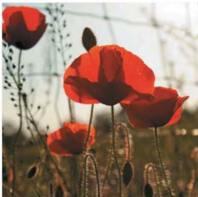
4. oldal – Karl Dávid: Szántó szélén