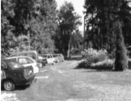
Itt látható a ház udvara

Ez év júliusában részt vettünk Mátrafüreden, a Tököli Tai Chi Chuan és Saolin kungfu csoporttal az évente szokásos egyhetes táborozáson. Szálláshelyünk a Mátra kellemes erdős részén fekvő apartmanházban volt.