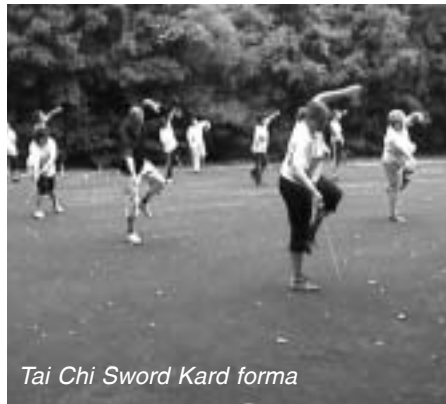
Tai Chi Sword Kard forma