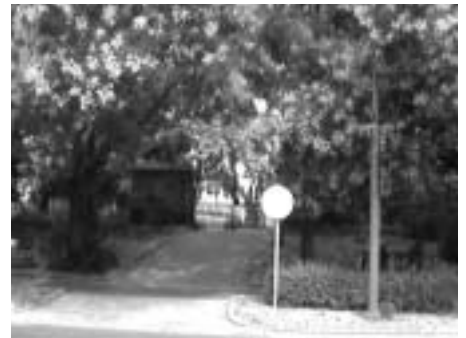
Az Orczy kastély, melynek felújítása 2007-ben fejeződött be, csak a bejáratot fényképezhettük