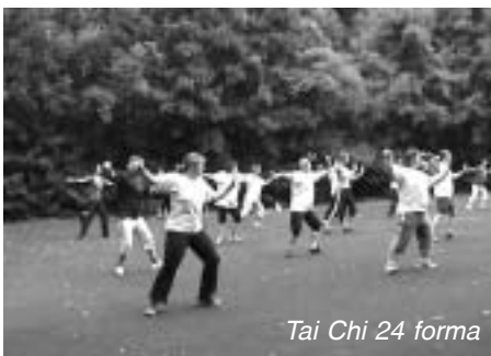
Tai Chi 24 forma

Az alábbi képek a különböző formagyakorlatokból ad ízelítőt és talán kedvet a Tai Chi-hoz.