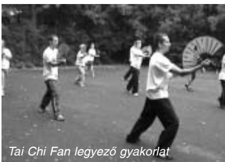
Tai Chi Fan legyező gyakorlat