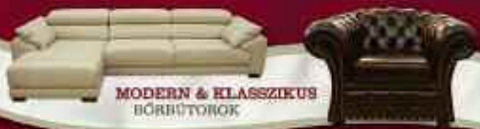
MODERN & KLASSZIKUS BŐRBŰTOROK