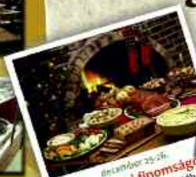
október 25-26. Karácsonyi finomságok a Kisduna Étterem kártyájában

Minden nap, 12-15 óra között svédasztalos ebédet kínálunk korlátlan ötfogyasztással!