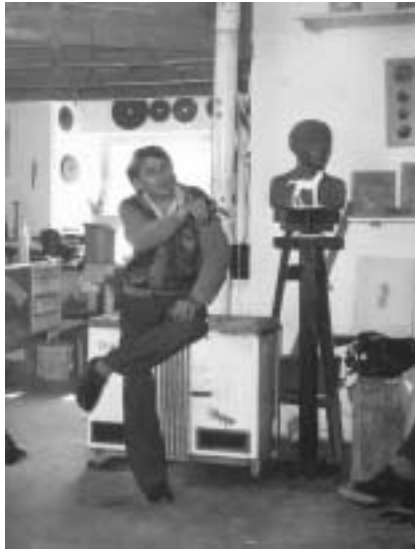
Jellemző pillanat a műteremben