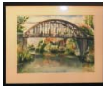
Lövészné Nagy Erzsébet