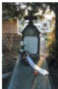
A szülők sírja