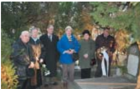
Haraszti KDNP-sék megemlékeznek a szülők sírjánál

jegyző fel is vette volna, de ő többre vágyott, mint a segédjegyzőség. Nagy küzdelmek után továbbtanult a Királyi Magyar Pázmány Péter Tudományegyetem Jog- és Államtudományi Karán, és szerzett jogi doktori oklevelet.