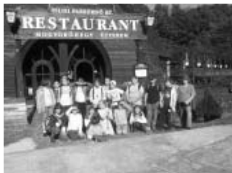
4. a osztály

Az első megállónk a Salamon torony volt, ahol élő történelemóra várt ránk. Az előadás keretében bemutattak néhány középkori fegyvert. Megengedték, hogy beüljünk egy kinzószékbe, és felpróbáljunk pár sisakot és páncélmellényt. Ezután lementünk a Duna-partra sétálni egyet. A fiúk közül többen is elmentek gyíkra vadászni. Természetesen miután megfogták, el is engedték őket.