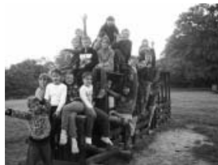
4. c osztály