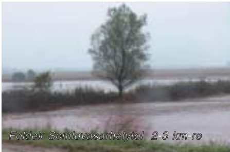
Foldek Somlóvásárhelytől 2-3 km-re