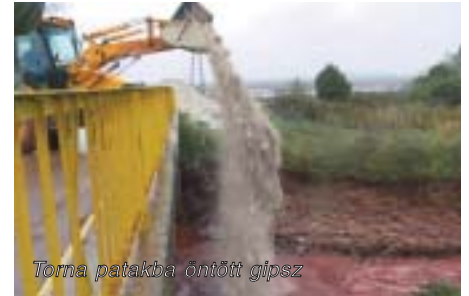
Torna patakba öntött gipsz

A megdöbbentő hír hallatán, hogy 2010. október 4-én délben, átszakadt az ajkai timföldgyár zagyatározójának fala. Mintegy 700 ezer köbméter „vörös iszap” öntött el a településeket, így környezeti katasztrófát okozva a térségben. Szinte egyszerre gondoltuk a Dunaharaszti Környezetbarátok Egyesületének tagjaival együtt, hogy nekünk is segíteni kell! Azonnal munkához láttunk és felvettük a kapcsolatot az előntött települések jegyzőivel, akik elmondták, mire is van most szüksége az ott élő embereknek. Városunk honlapján és e-mail rendszeren keresztül meghirdettünk egy adománygyűjtést. A gyűjtés során, Dunaharaszti város lakosai segítőkészségükről és együttérzésükről tettek tanúbizonyságot! A magánemberek és a felhíváshoz csatlakozott szervezetek, adományaiból közel 1 000 000 Ft értékű