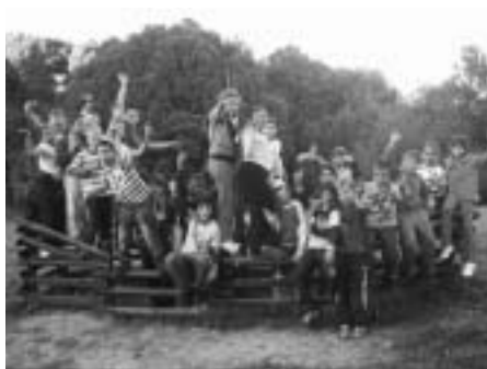
4. b osztály