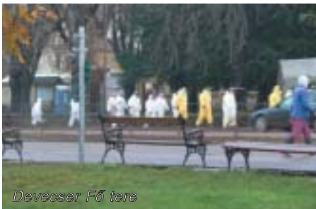
Devecser Fő tere