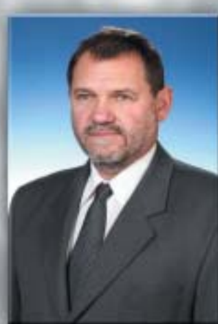
Lehel Endre alpolgármester