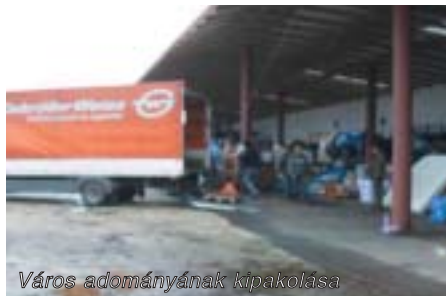
Város adományának kipakolása