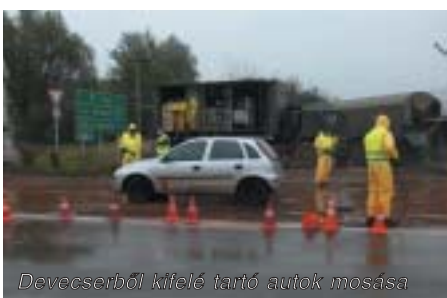
Devecserből kifelé tartó autók mosása