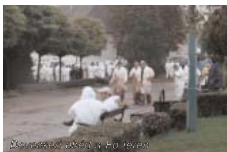
Devecseri ebéd a Fő téren