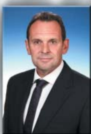
Karl József alpolgármester